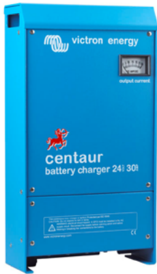
Centaur Battery Charger 24 30