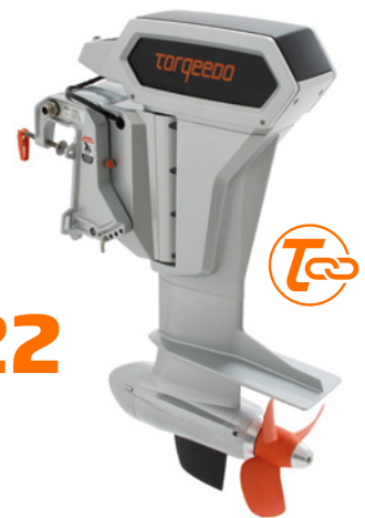
CRUISE 6.0 T/R*